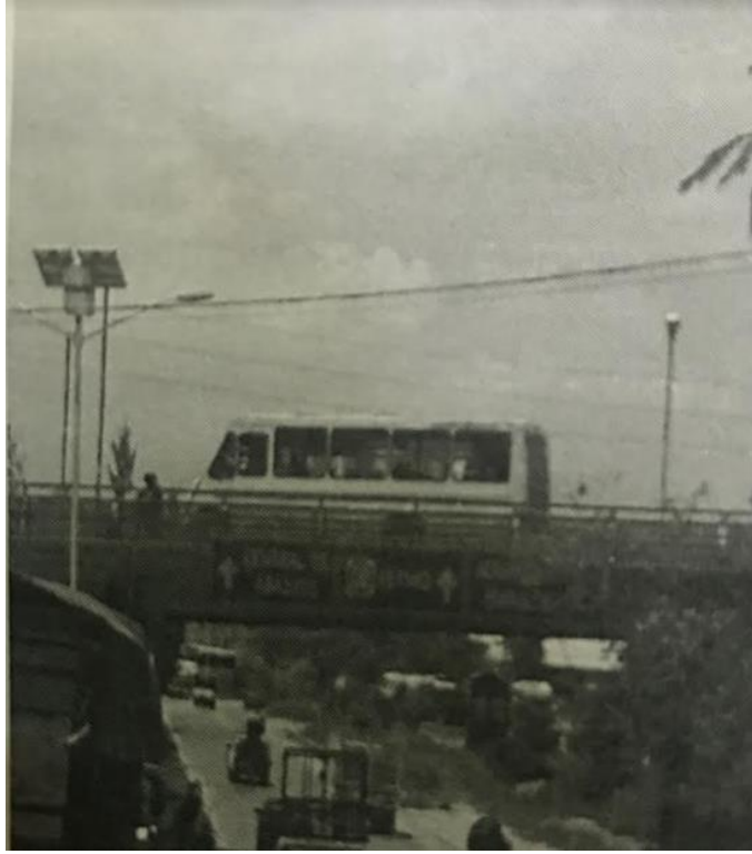
Calle Constituyentes, Central de Abastos, Ciudad de Oaxaca.