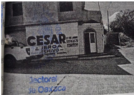
IMAGEN 2: 10

Contenido: “... enseguida una parte parcialmente abierta, y donde se pueden ver lo que parecen ser una flores, y una figura en bulto de lo que parecer ser una persona, la cual al parecer porta vestimenta de color verde y roja, detrás de ella se puede ver una figura irregular al parecer de color dorado ...”