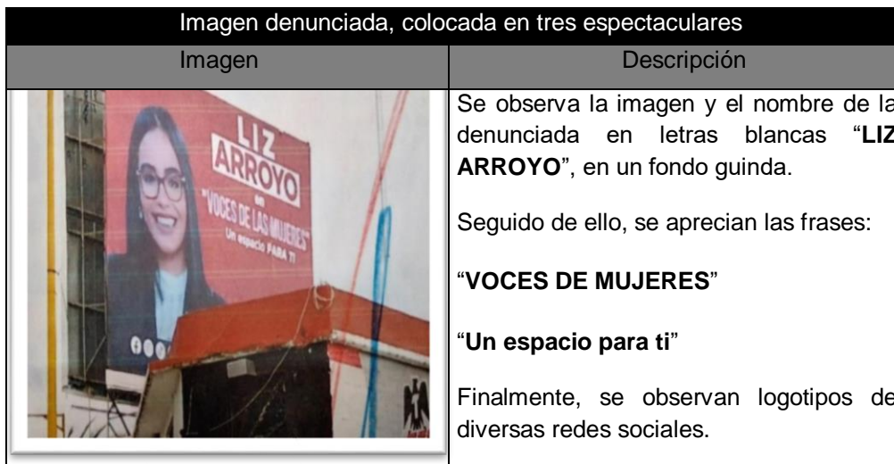
Imagen denunciada, colocada en la parte trasera de tres urbanos y suburbanos

A continuación, se insertan las publicaciones denunciadas tanto en espectaculares como en la parte trasera de transportes urbanos y suburbanos, en donde se describirá el mensaje que contienen, posteriormente serán analizadas a efecto de determinar si se configura o no este elemento.