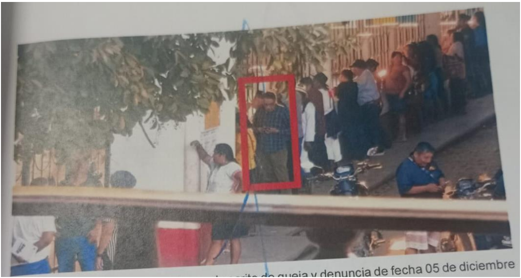
...rito de guía y denuncia de fecha 05 de diciembre