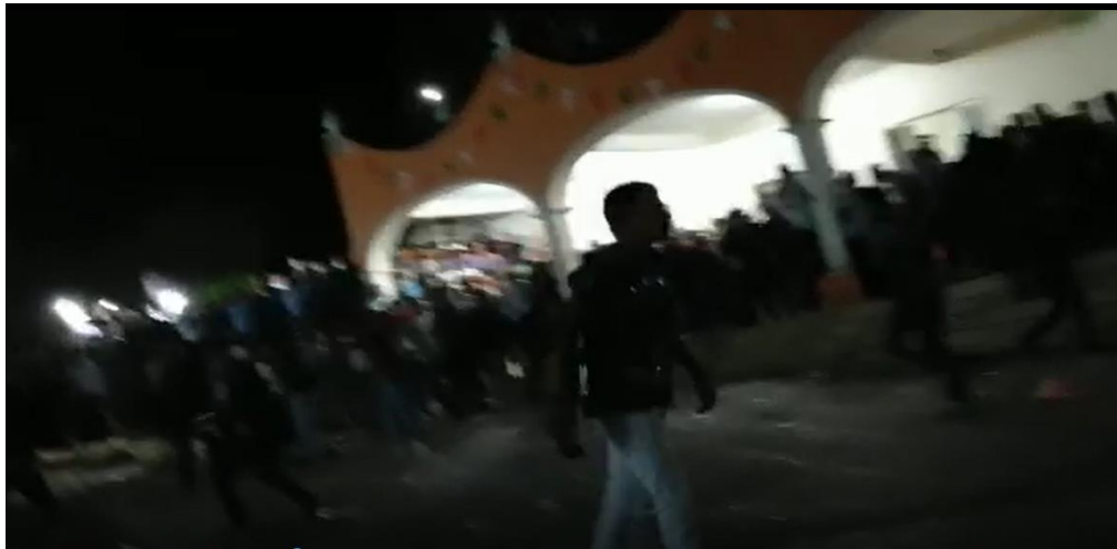
Imagen capturada del video en el segundo dieciséis, de la cual se aprecia a tres personas en el centro de una explanada, con aproximadamente ochenta personas alrededor.

Disco compacto 1: San Simón Zahuatlán 1. Del cual se desprende un video con una duración de dos minutos con treinta y un segundos: