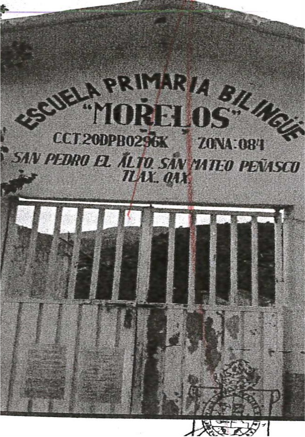
Imagen 2, autoridad encargada del proceso electivo