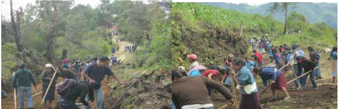
El tequio en la agencia municipal de San Juan Guivini.

Programa de Empleo Temporal. Y la construcción de la Plaza cívica en la escuela tele-secundaria.